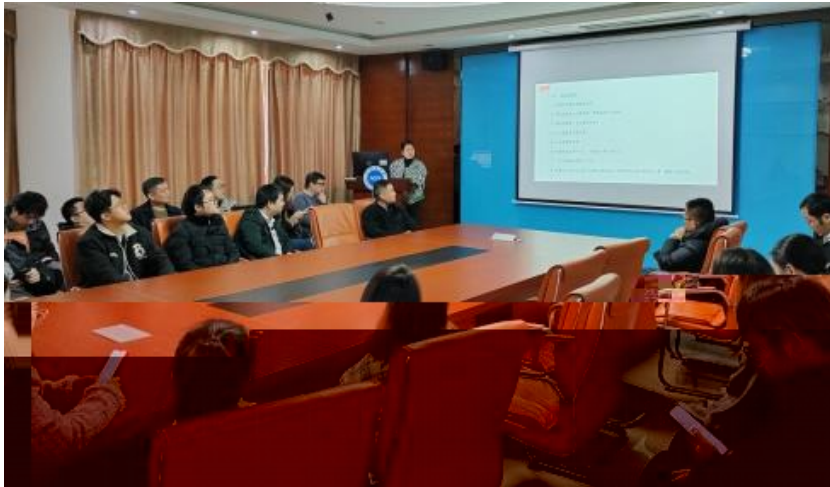
图 员工专业技能培训

2023 年，公司促进发展和人才方面取得 成效。通过创新的和，不动公司的 持续增长，工提供的发机会。过供多 化的和发， “队共”等 活动（4-5），帮工技和管；并 的和规划，工的合和， 包导发计划、技技及部 等，地促工的方发。