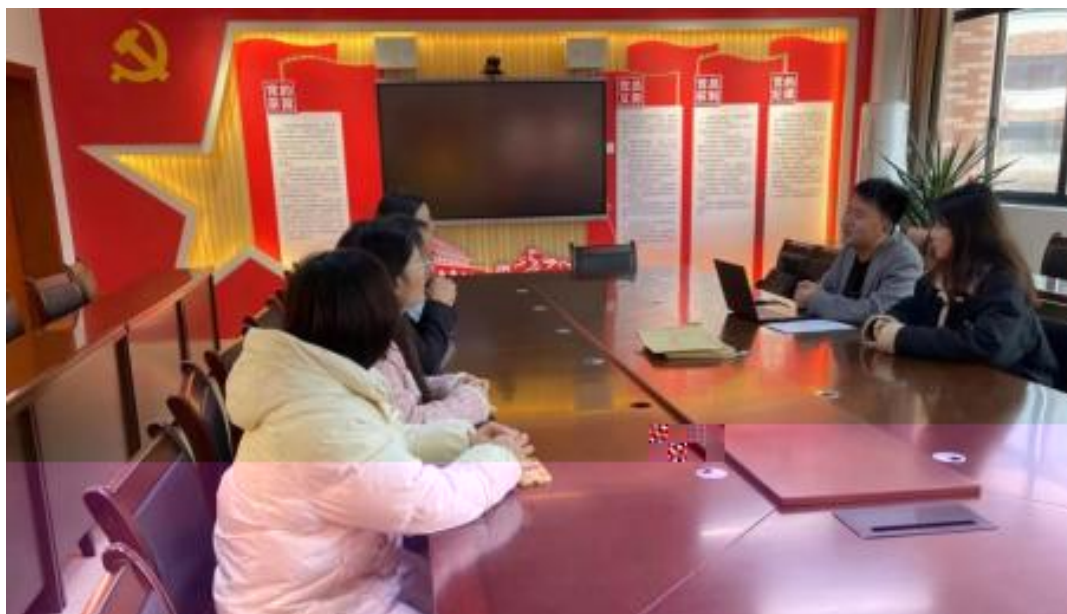
图 校企开展学术研讨项目交流会议

公 高度 队 的 ，充分 到 和 的关 ，对 高 和 关 的 。此公 供 ，包 更 、 方法 及 导 发 程，并 持 丰富 的 家 过 、 会 和 际案 ， 队 分 的 和 。 常 地 活动， 包 参加 会 、 等 ， 促 的 的 分 ， ， 并 的 队 ( 1)。